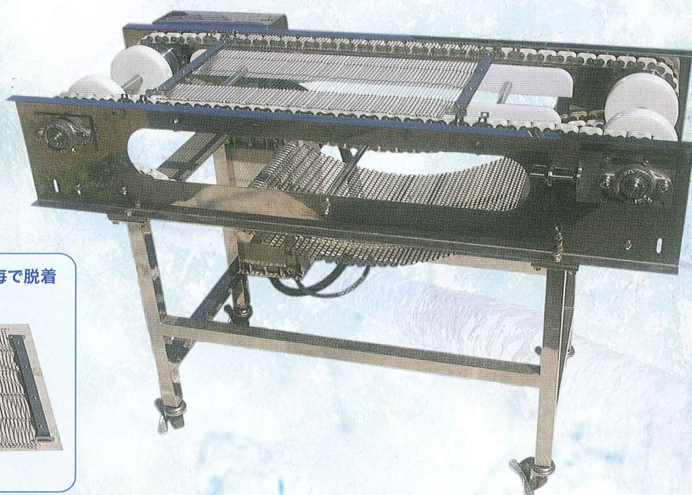
1ブロック毎で脱着