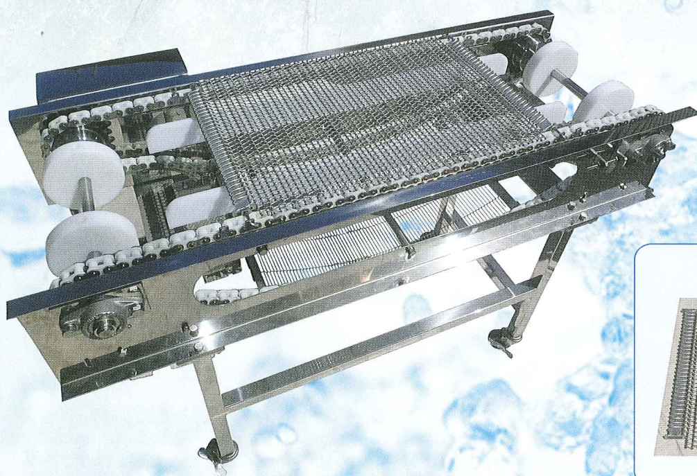
1ブロック毎で脱着